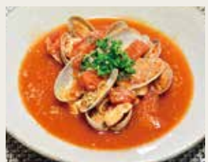
【魚介と濃厚トマトスープ】

トマトは、皮の細胞壁の中にリコピンが多く含まれているため、丸ごと食べることで、栄養素を無駄なく摂取できます。また、リコピンは油と一緒に食べると吸収されやすくなり、加熱すると吸収率が倍増します。夜よりも朝、空腹時に食べるよりグッド!迷った時は、食物繊維量や抗酸化力が高いミニトマトを選びましょう。