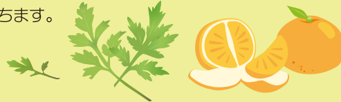
発行/万来舎 ● 発売/エイブル 転ばぬ先の玉手箱

ヨモギの新芽と干したミカンの皮を細かく刻み、ネギの苗の根元に触らないようにグルリと撒いておくと、ネギのウジ虫の防除になります。また、ネギの横にハウレン草を植え付けると、病原菌や過剰な養分を吸収してハウレン草のえぐみが少なくなり、スッキリとした上品な味わいのネギに育ちます。